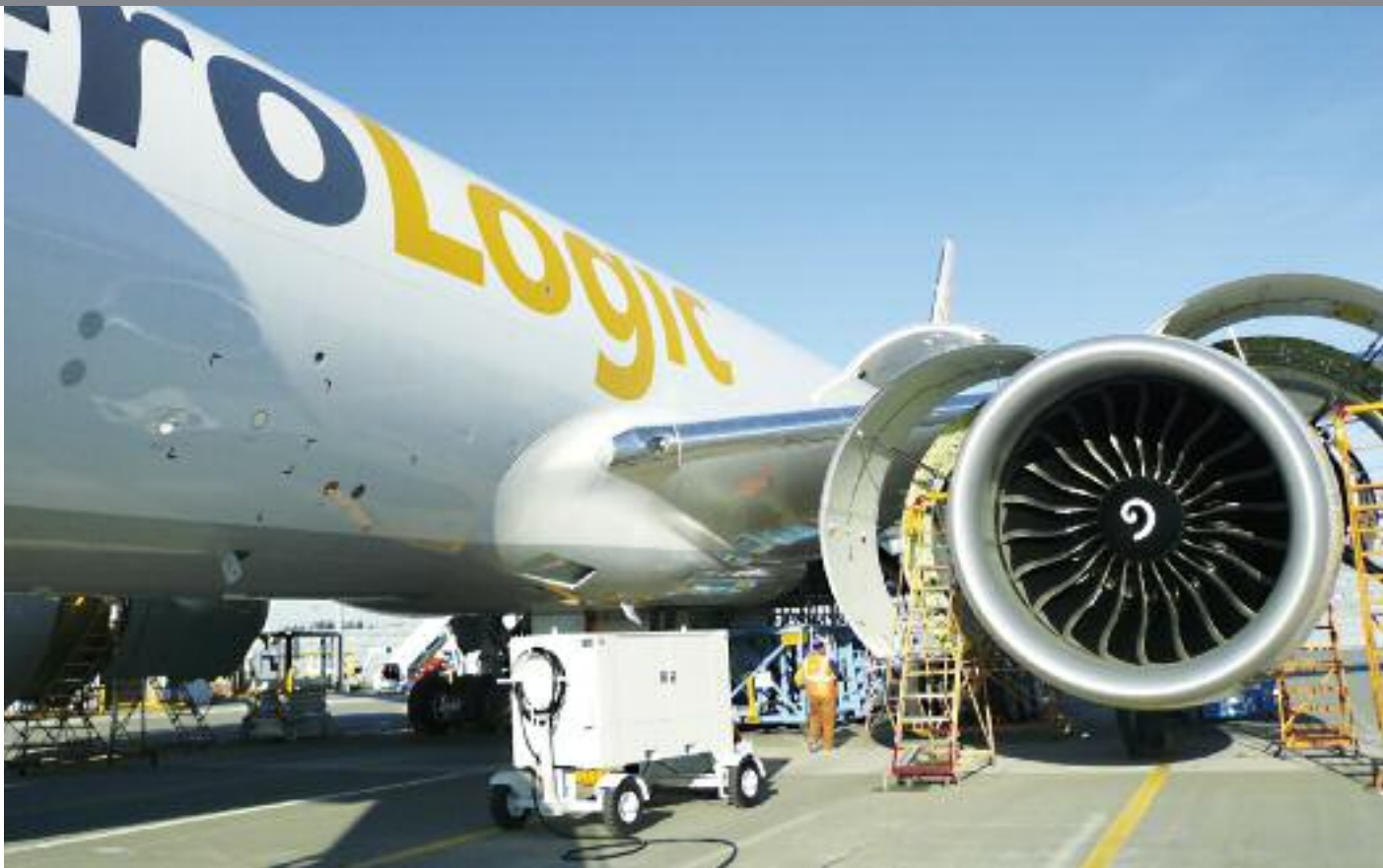
„LIMA CHARLIE“, das Flugzeug des DCM Flugzeugfonds 3, bei der technischen Abnahme im Dezember 2009*.