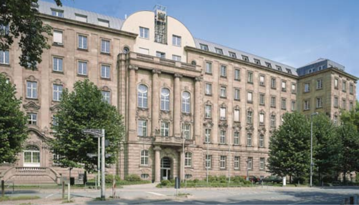
Das neoklassizistische Westend-Palais ist die imposante Fondsimmoblie der DCM 18 KG mit einer Investitionssumme von € 193 Mio.

Unser Auslandsengagement im Immobilienbereich startete nach fast zweijähriger Vorbereitungszeit und intensiven Recherchen der Marktgegebenheiten mit einem Fonds, der mit € 86 Mio. in äußerst hochwertige Büroimmobilien in Budapest investierte. Ein modernes Bürogebäude in Dallas, der Centura Tower, war Investitionsobjekt des ersten US-Immobilienfonds. Die Bürogebäude in Budapest konnten inzwischen gewinnbringend für die Anleger veräußert werden.