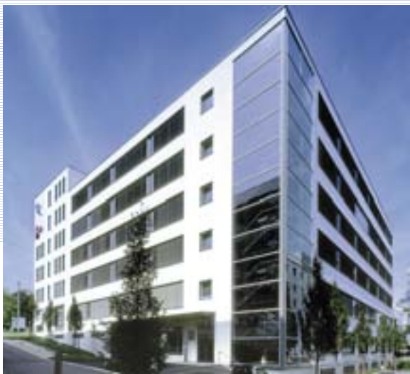
Das ibis-Hotel in Stuttgart, die Fondsimmobilie der DCM 19 KG.

Gute Beispiele hierfür sind unsere beiden zuletzt aufgelegten deutschen Immobilienfonds: Die DCM 23 KG („ImmobilienWerte Deutschland“) investierte mit einem Gesamtinvestitionsvolumen von € 423 Mio. in sieben Büroimmobilien in unterschiedlichen deutschen Ballungsräumen. Die Standorte, die namhaften Mieter mit langen Mietvertragslaufzeiten und die bauliche Qualität der Objekte waren starke Argumente für diesen Fonds, dessen Immobilien mittlerweile in den Bestand der Prime Office REIT-AG überführt wurden. Einen soziodemografischen Zukunftstrend bediente die DCM 24 KG („Zukunftswerte“), welche in nicht weniger als 31 gut geführte Pflegeimmobilien investierte. Die Anleger beteiligten sich mit insgesamt € 170 Mio. Eigenkapital an einem Konzept, das im Umbau unserer Gesellschaft seine Chancen und in Deutschland seines Gleichen sucht.