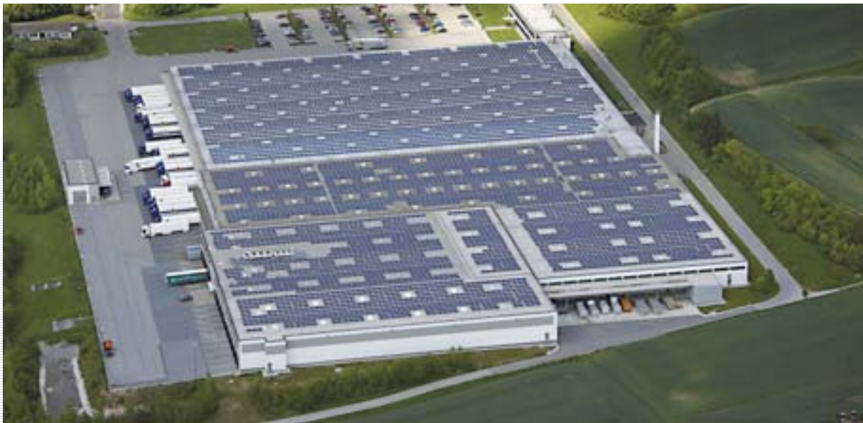
Eine Photovoltaikanlage des DCM Solarfonds 1 auf dem Dach des ALDI-Logistikzentrums im bayerischen Regensburg.