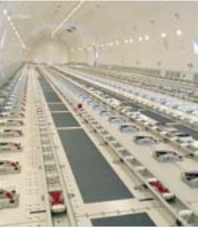
Die Boeing Triple Seven – „die neue Königin am Cargo-Himmel“: Der Maschine der ersten DCM-Flugzeugfonds gehört die Zukunft im wachsenden Luftfrachtmarkt.

2008 erwarben wir für unsere neue Sparte Flugzeugfonds vier große Frachtmaschinen vom Typ Boeing 777F. Diese werden im Rahmen von drei Fonds einem breiten Publikum zur Beteiligung angeboten.