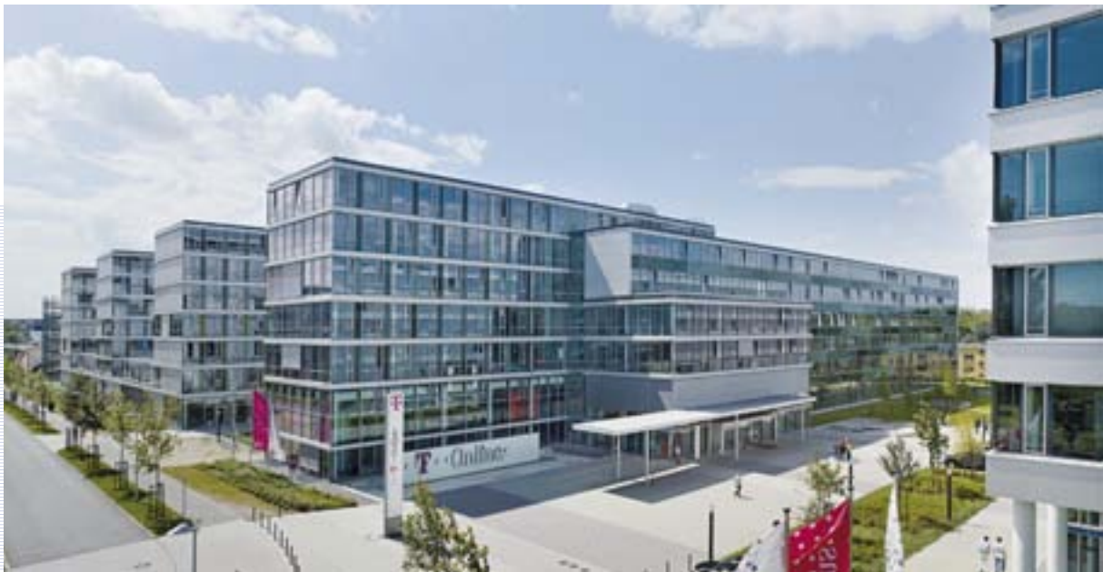
Die Zentrale von T-Online in Darmstadt wurde von der DCM im Rahmen der DCM Renditefonds 22 KG entwickelt.

Mit diversen Reformen der Steuergesetzgebung wandelte sich in den letzten Jahren das Anlegerinteresse: Gefragt sind seither weniger steueroptimierende als ausschüttungsorientierte Anlagen, die wir heute sowohl im Immobiliensektor als auch in den Assetklassen Transport und Energie suchen und finden. Solar-, Container- und Flugzeugfonds sowie Beteiligungsangebote mit internationalen Objekten oder Spezialimmobilien bereichern nunmehr unser Angebot.